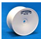
№240 軽量ディッシュホイール